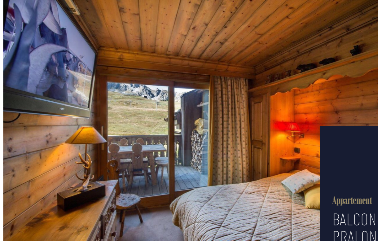
Appartement BALCON DE PRALONG COURCHEVEL | FRENCH ALPS