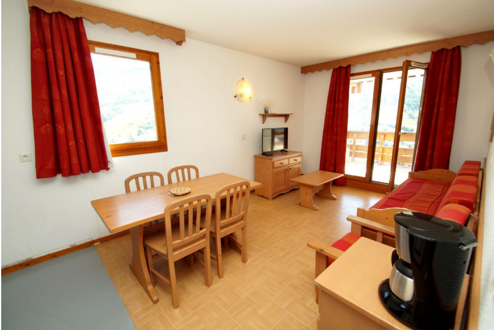
Apartment BALCON DU SOLEIL 203 LES DEUX ALPES