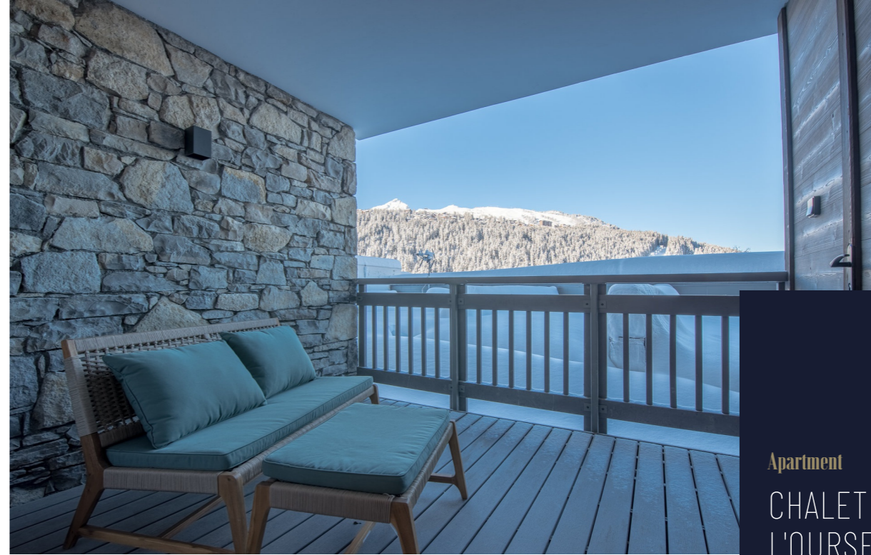
Apartment CHALET DE L'OURSE 3 COURCHEVEL