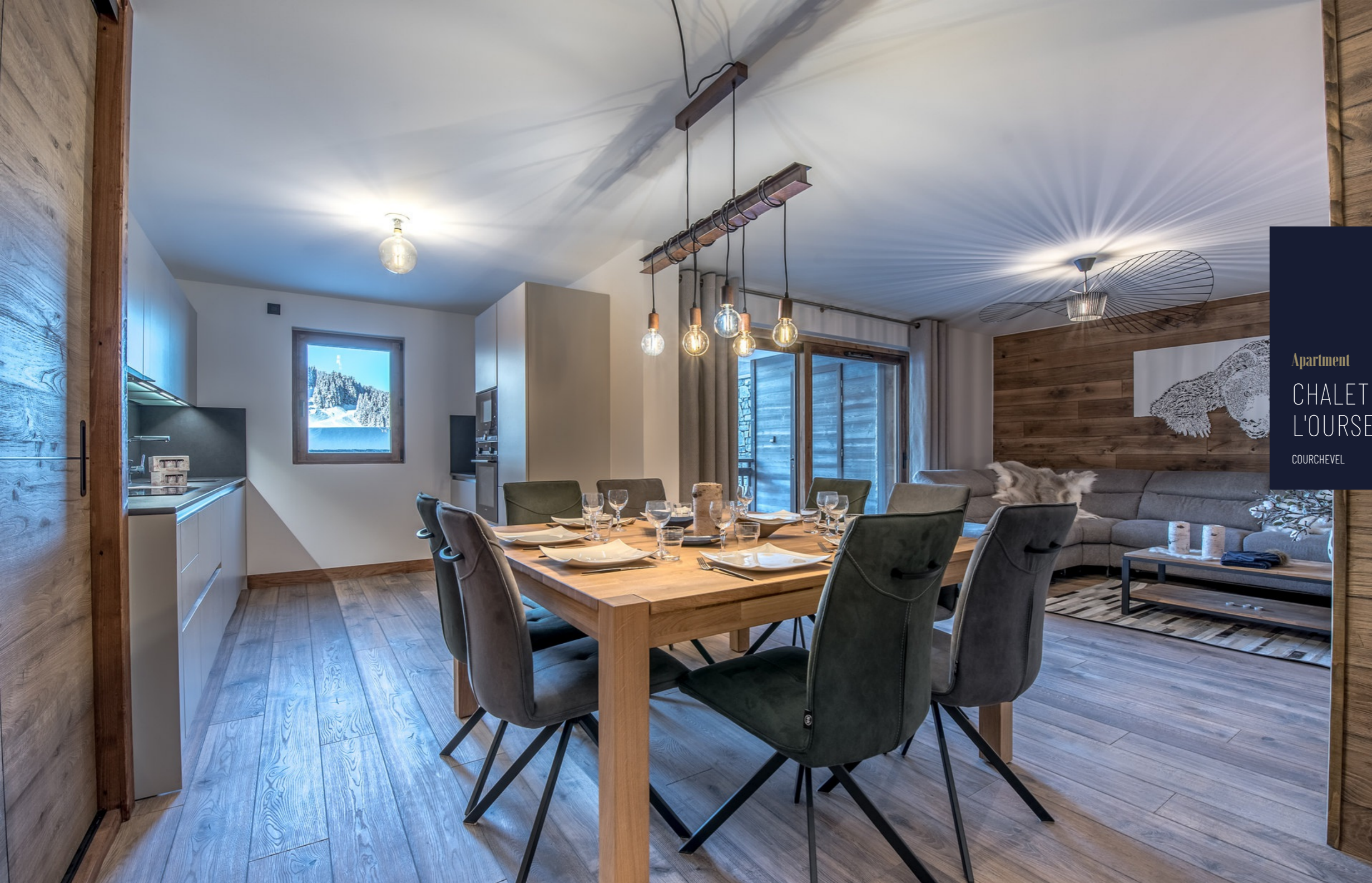
Apartment CHALET DE L'OURS 3 COURCHEVEL