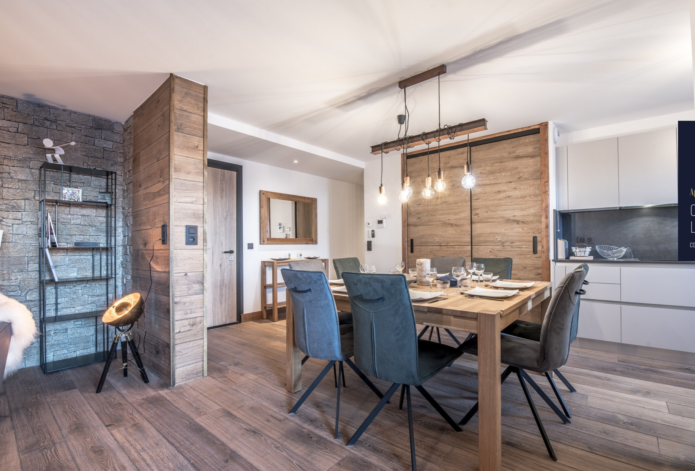
Apartment CHALET DE L'OURSE 3 COURCHEVEL