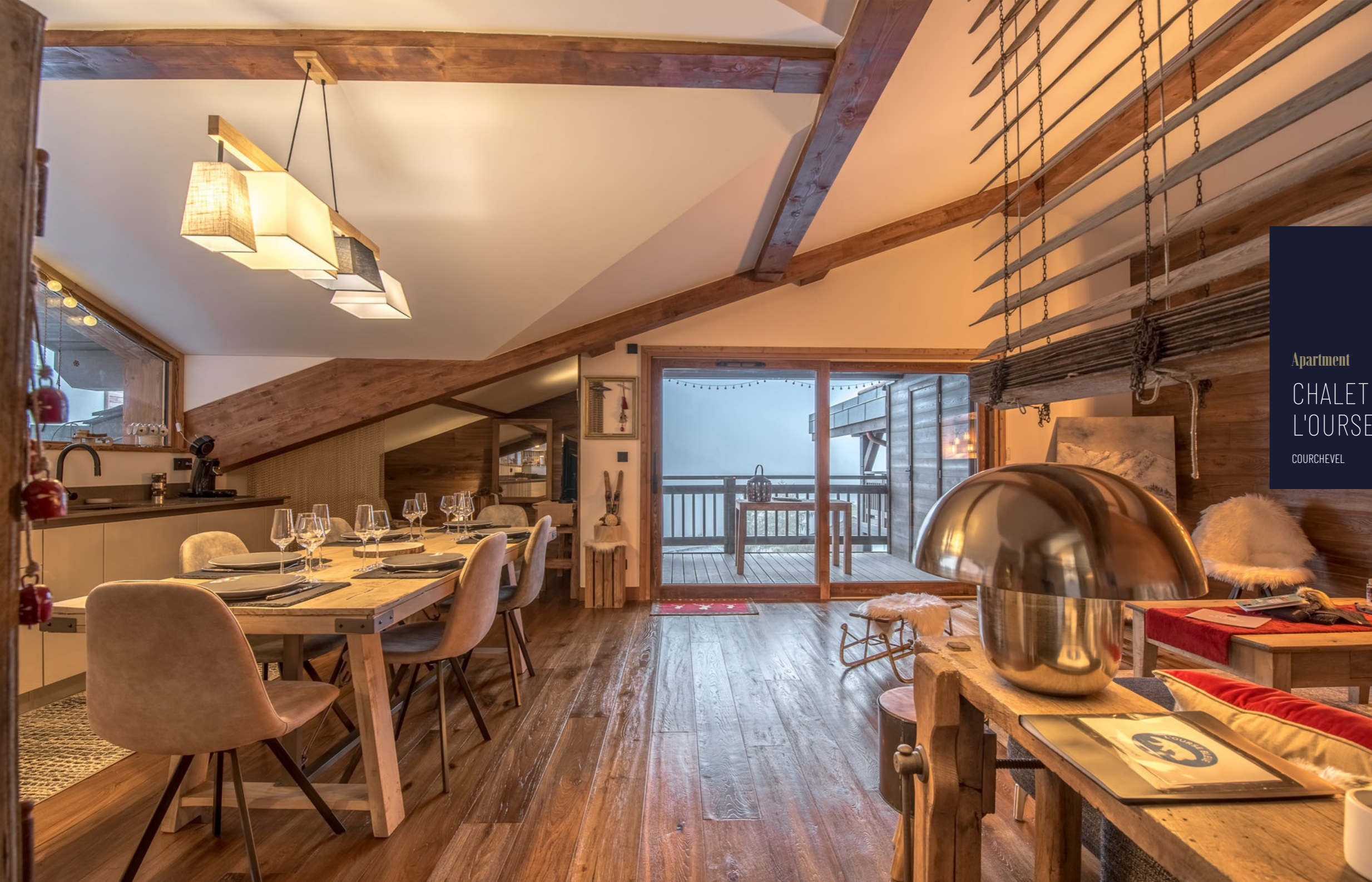
Apartment CHALET DE L'OURSE 9 COURCHEVEL