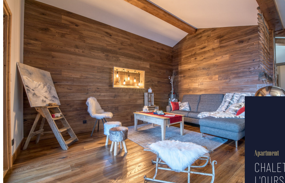
Apartment CHALET DE L'OURSE 9 COURCHEVEL