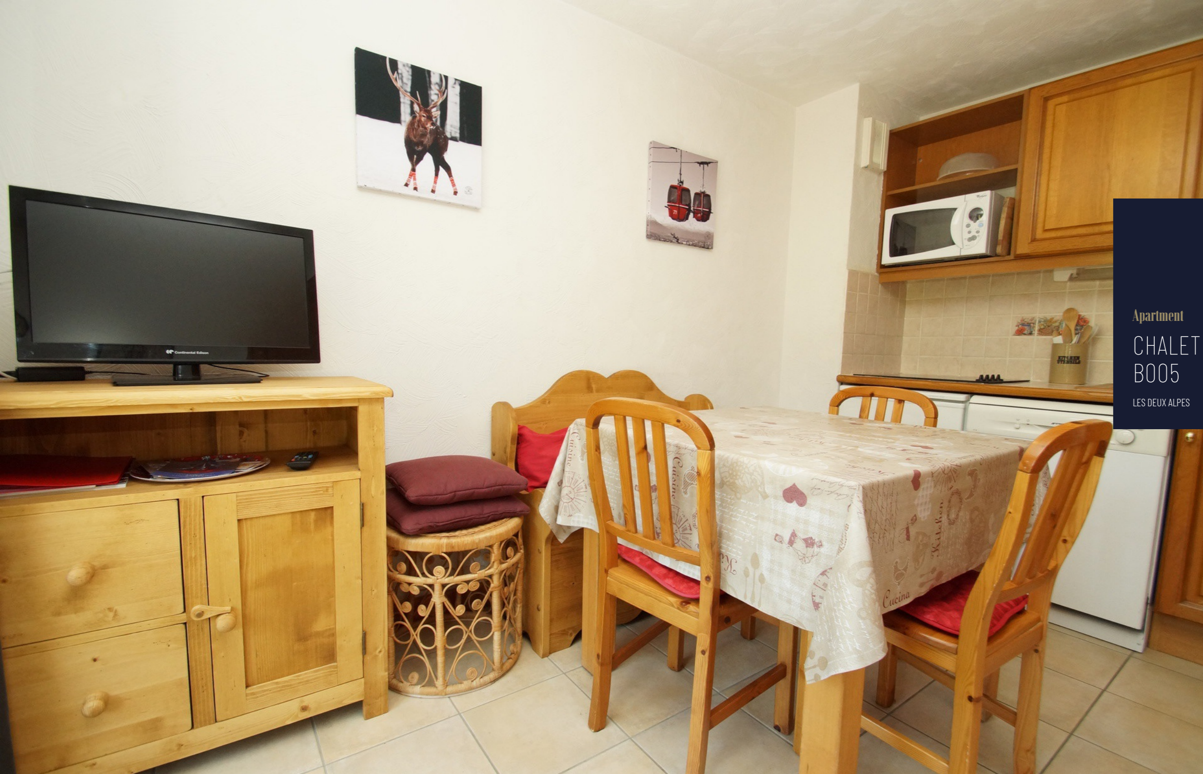
Apartment CHALET D'OR B005 LES DEUX ALPES