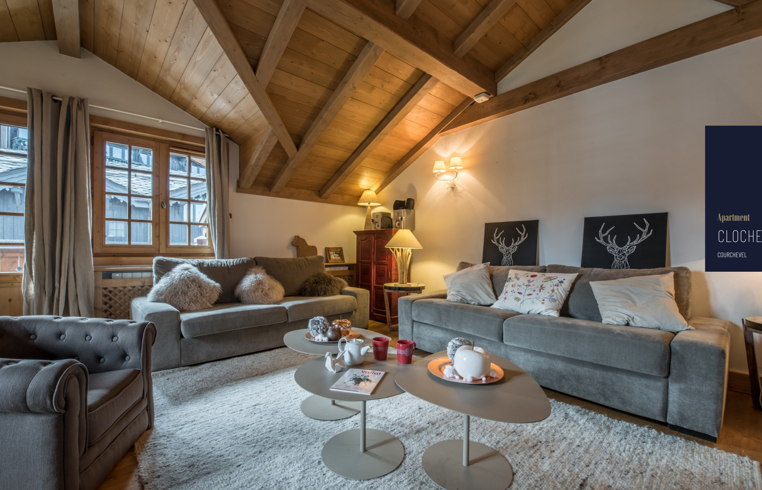
Apartment CLOCHER COURCHEVEL