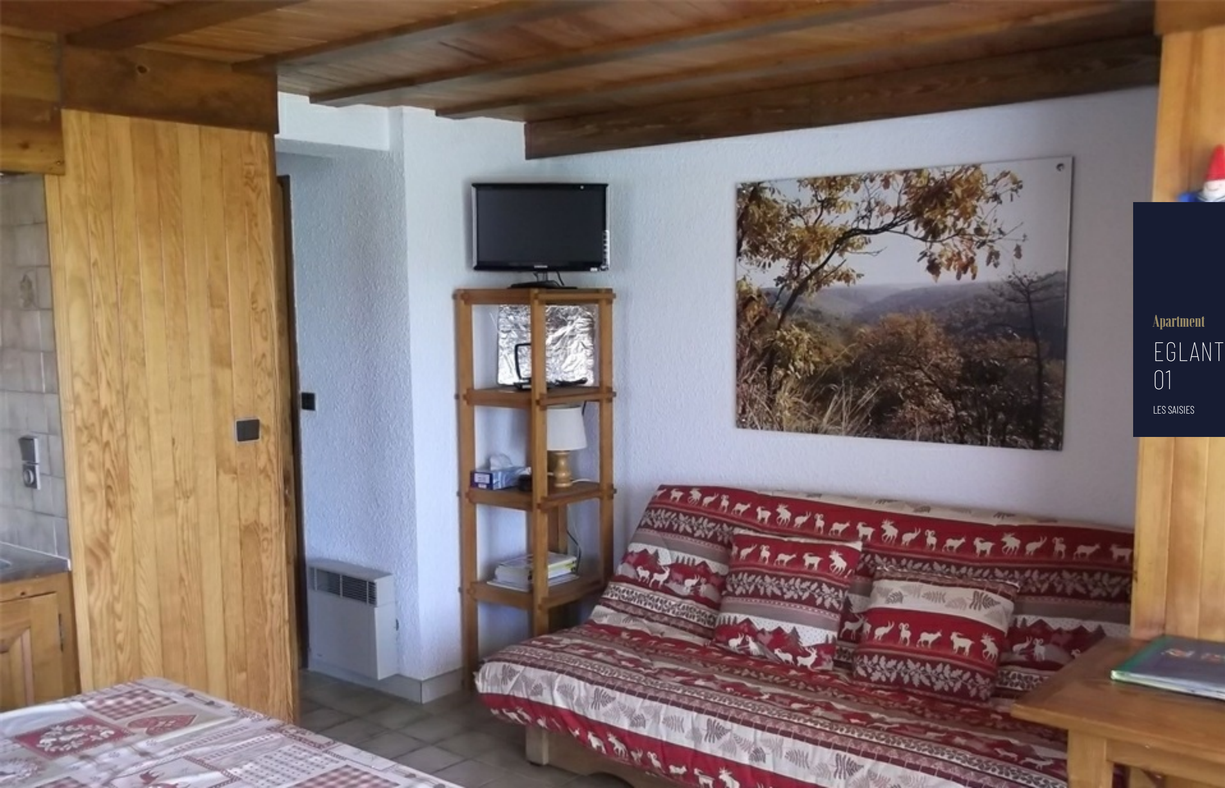
Apartment EGLANTINE 01 LES SAISIES