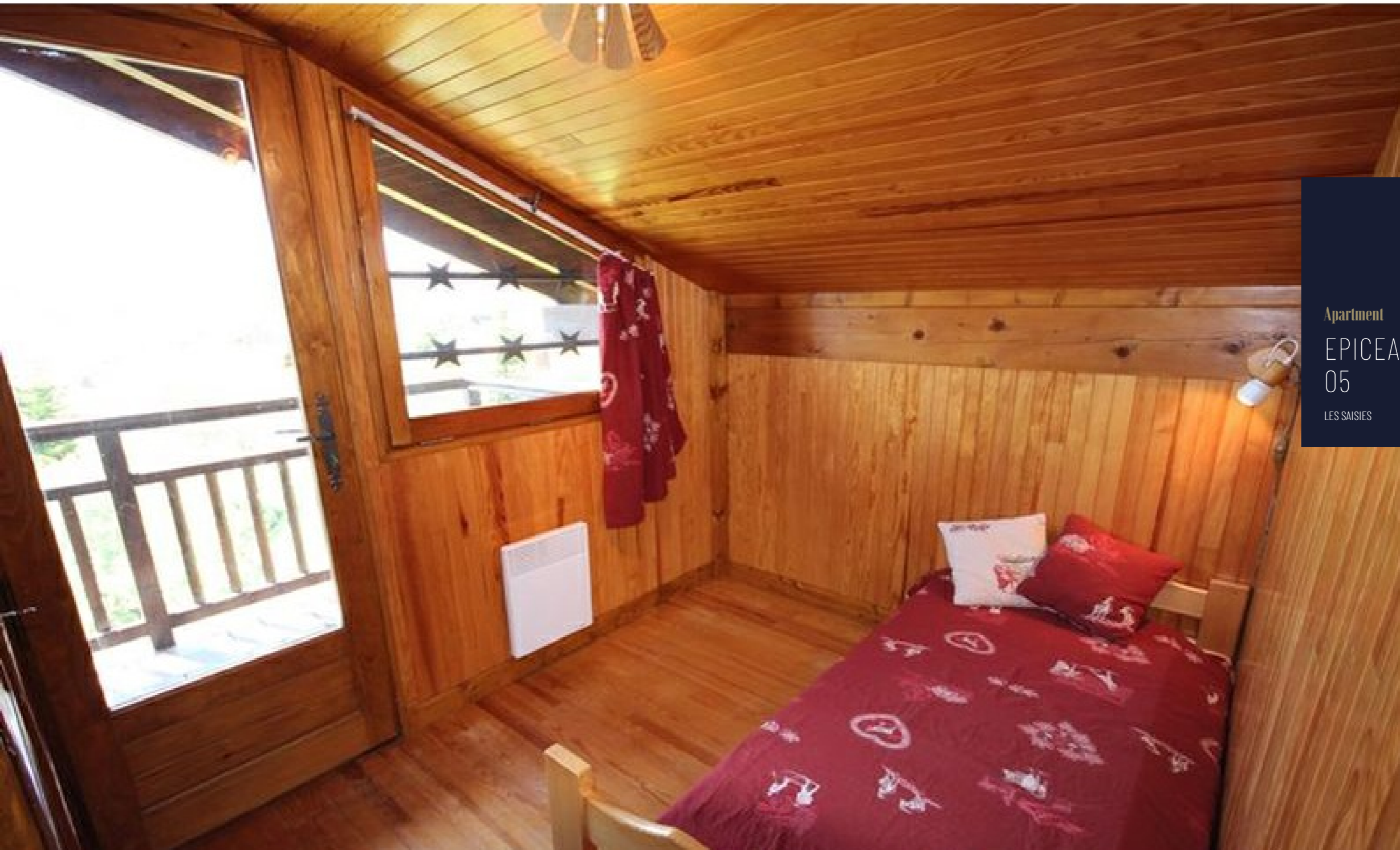
Apartment EPICEA 05 LES SAISIES