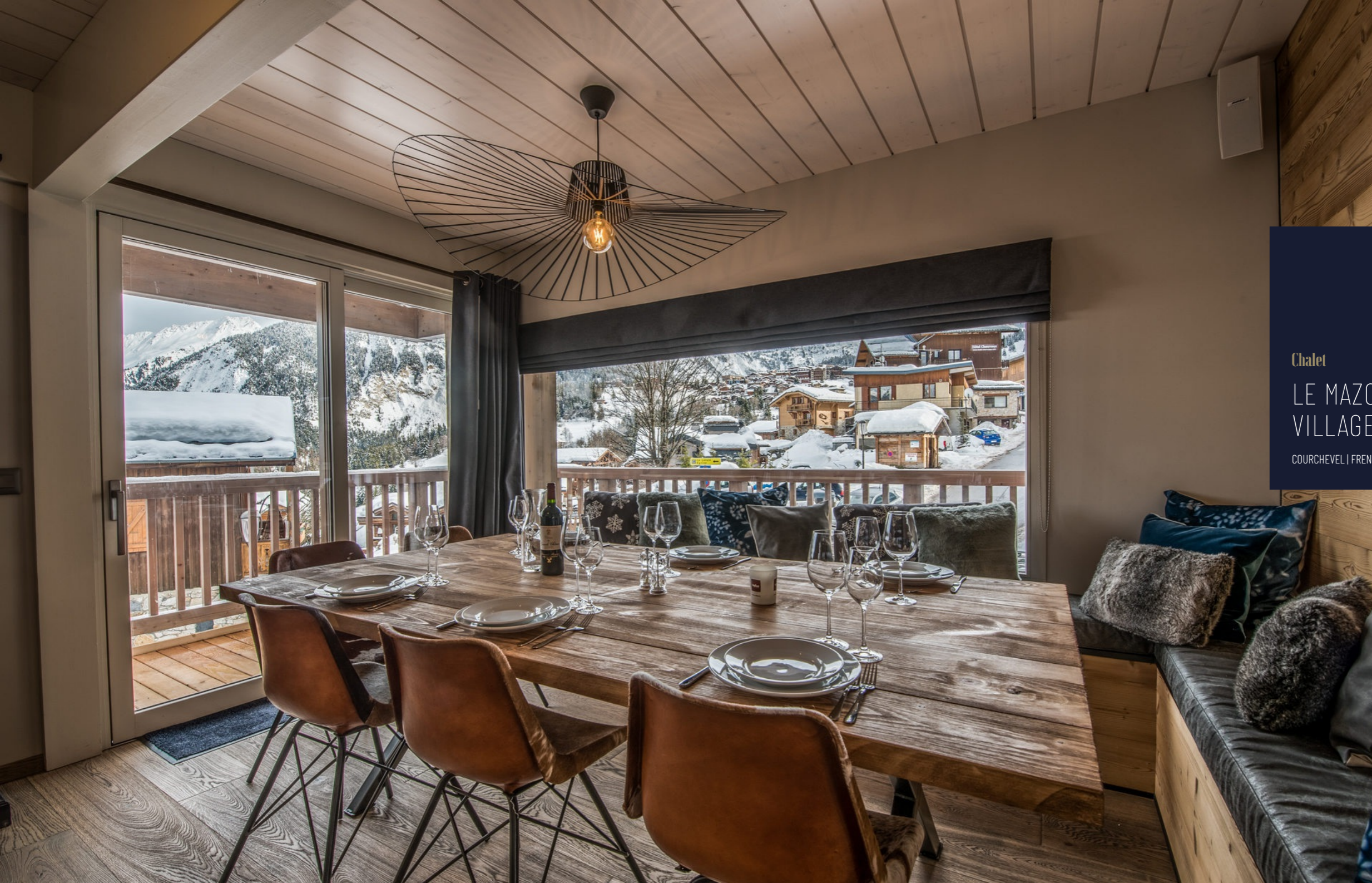
Chalet LE MAZOT DU VILLAGE COURCHEVEL | FRENCH ALPS