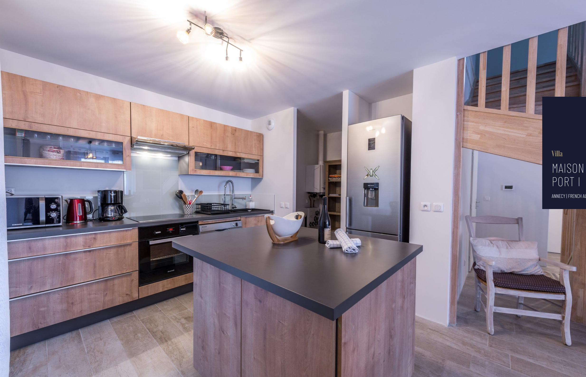
Villa MAISON DU PORT I ANNECY | FRENCH ALPS