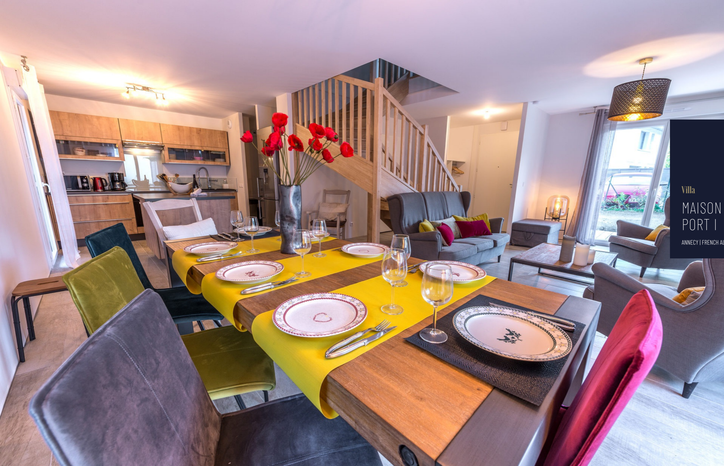
Villa MAISON DU PORT I ANNECY | FRENCH ALPS