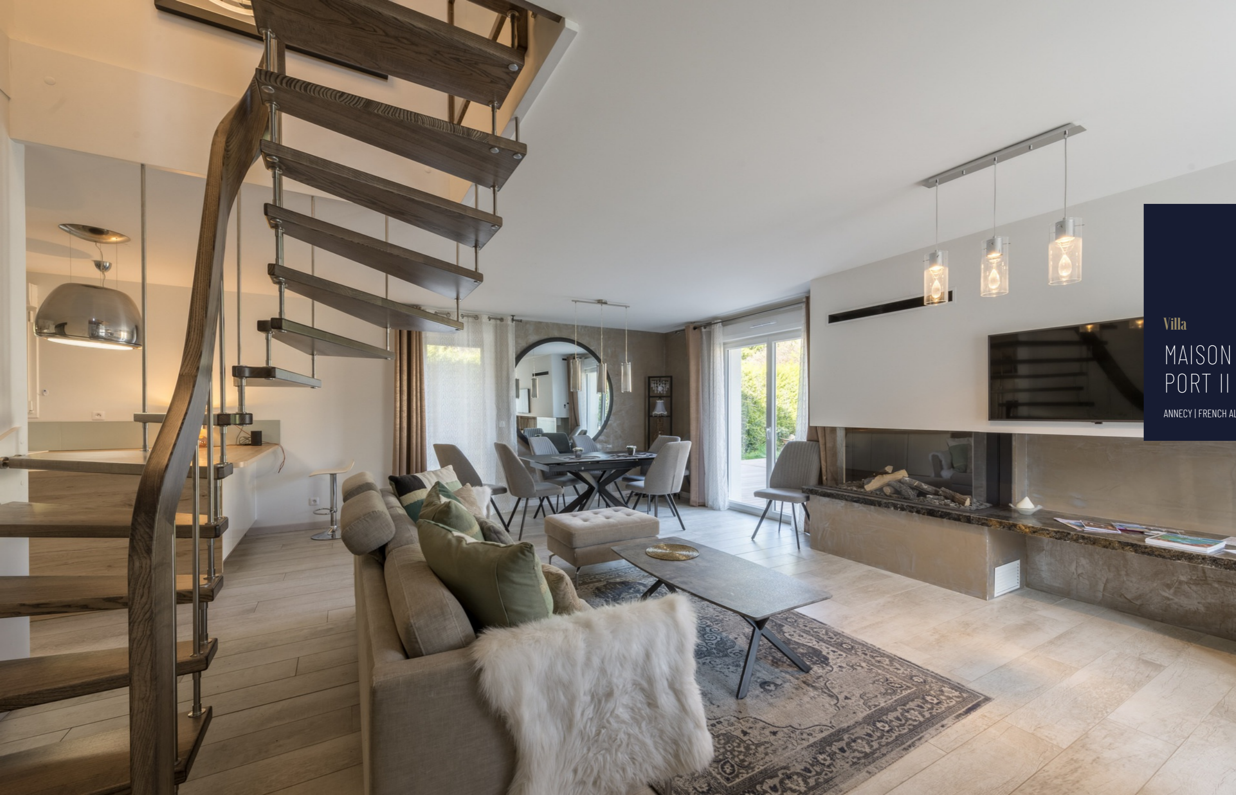
Villa MAISON DU PORT II ANNECY | FRENCH ALPS