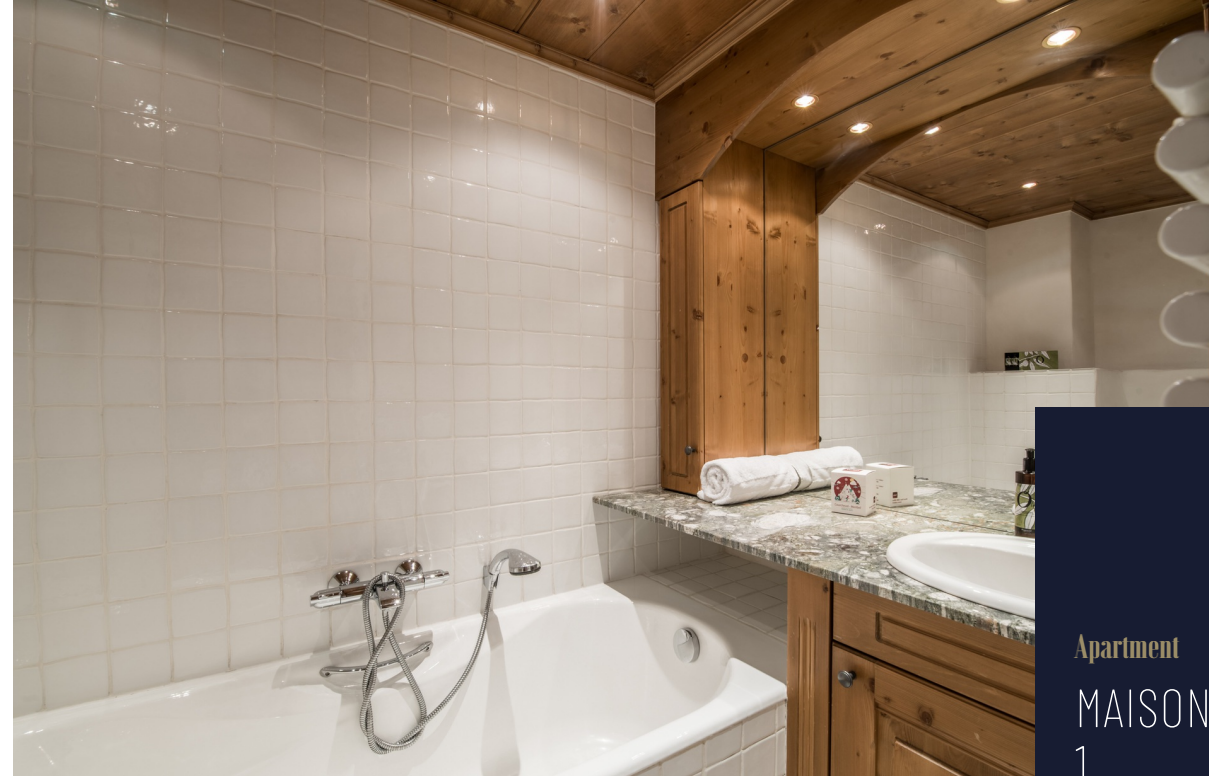
Apartment MAISONNEE 1 COURCHEVEL