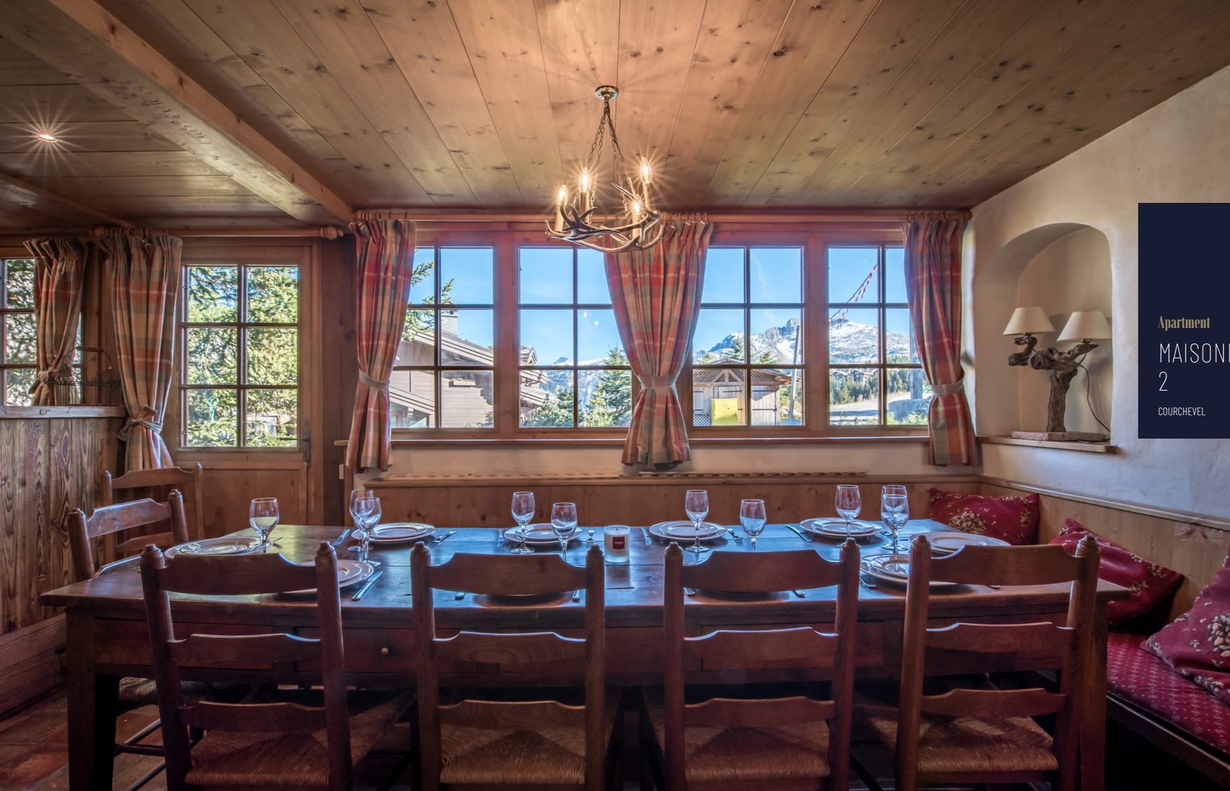
Apartment MAISONNEE 2 COURCHEVEL