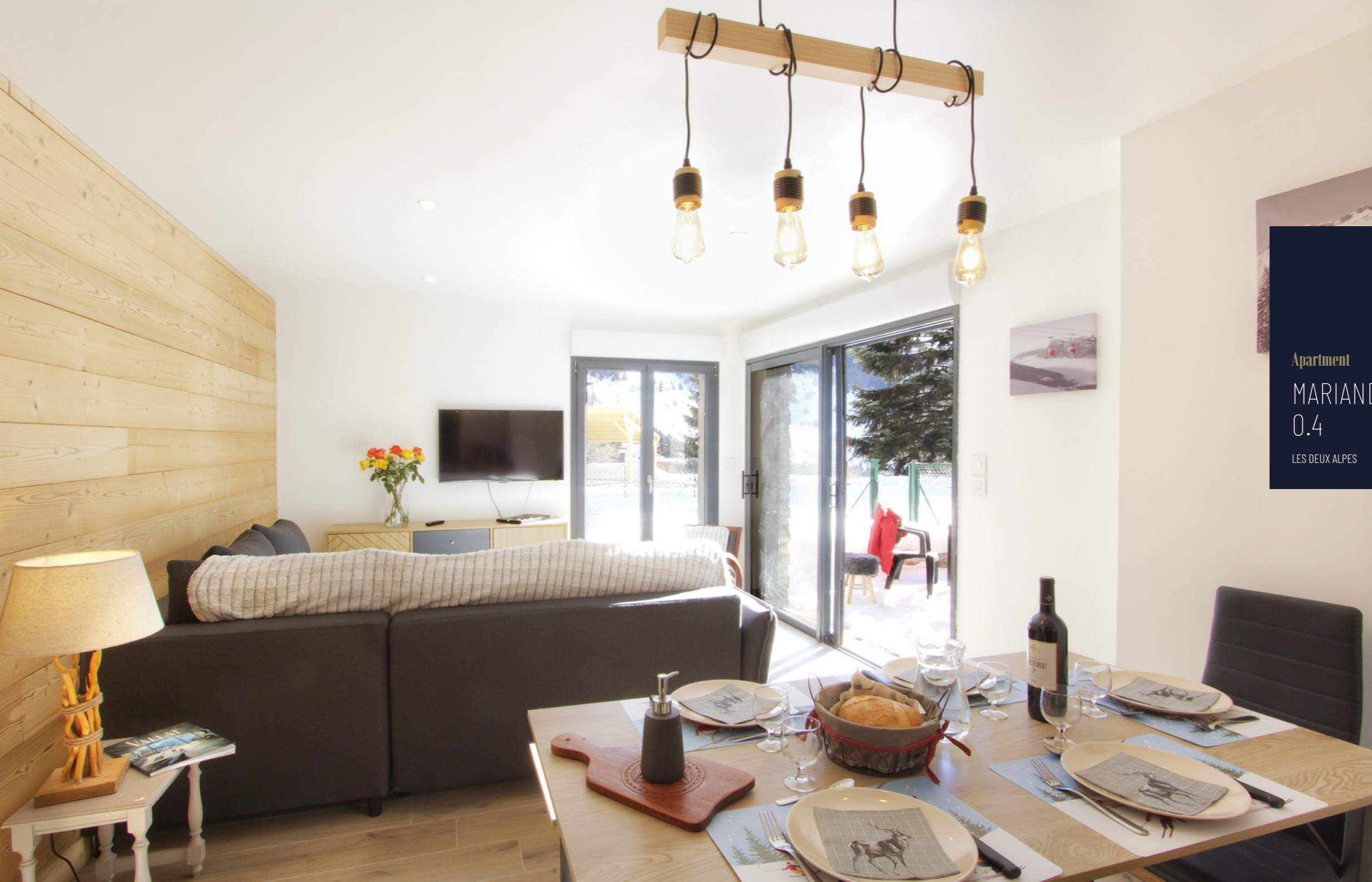
Apartment MARIANDE 0.4 LES DEUX ALPES