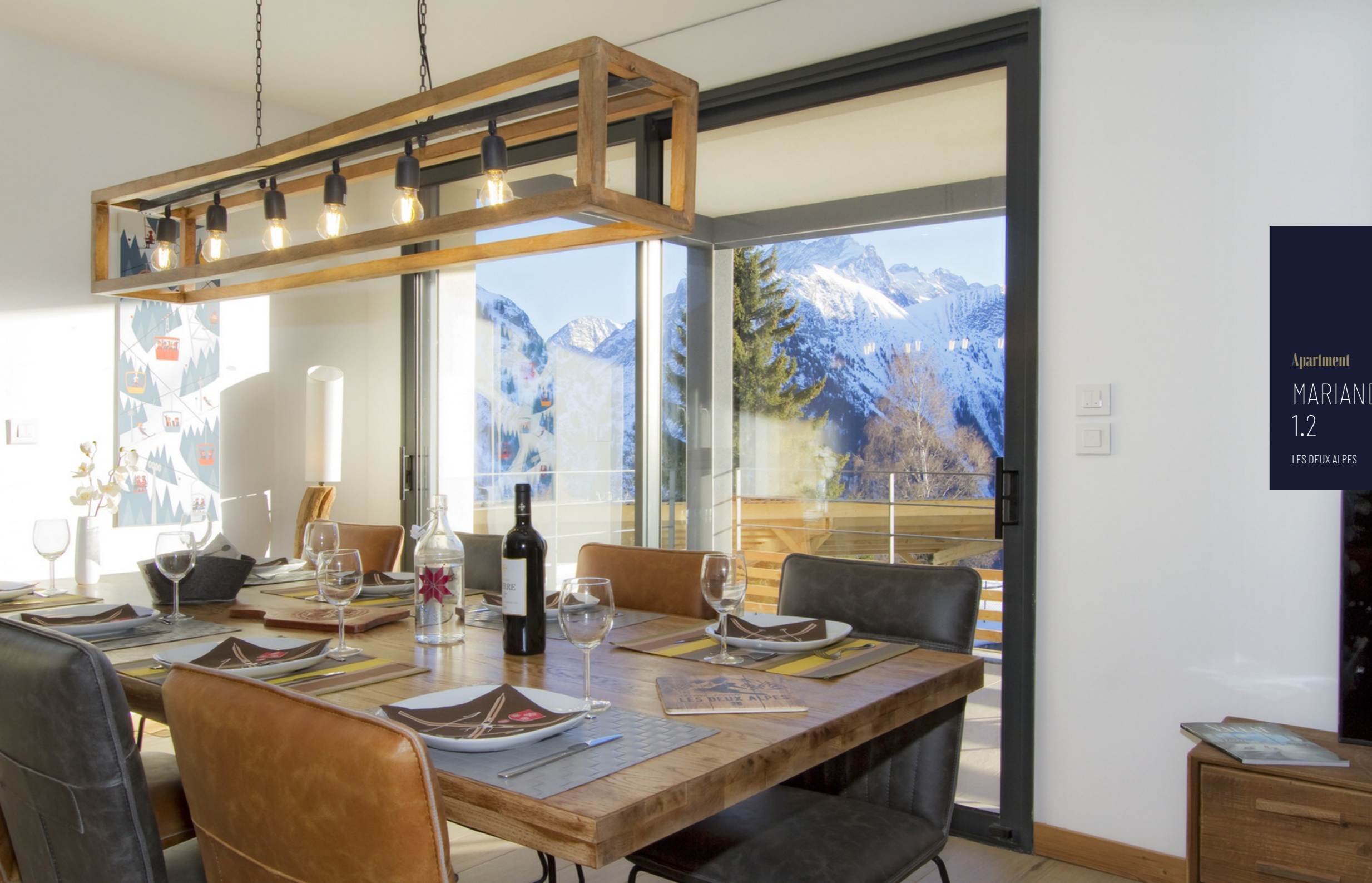
Apartment MARIANDE 1.2 LES DEUX ALPES