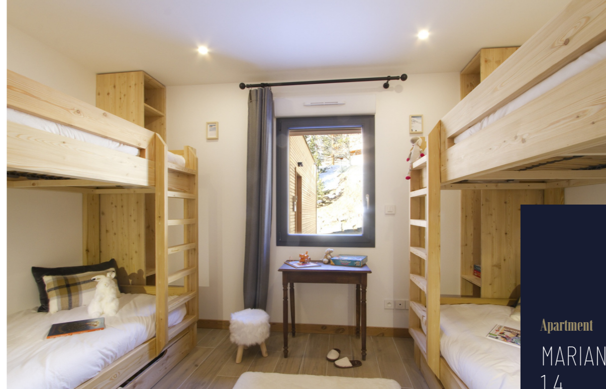
Apartment MARIANDE 1.4 LES DEUX ALPES