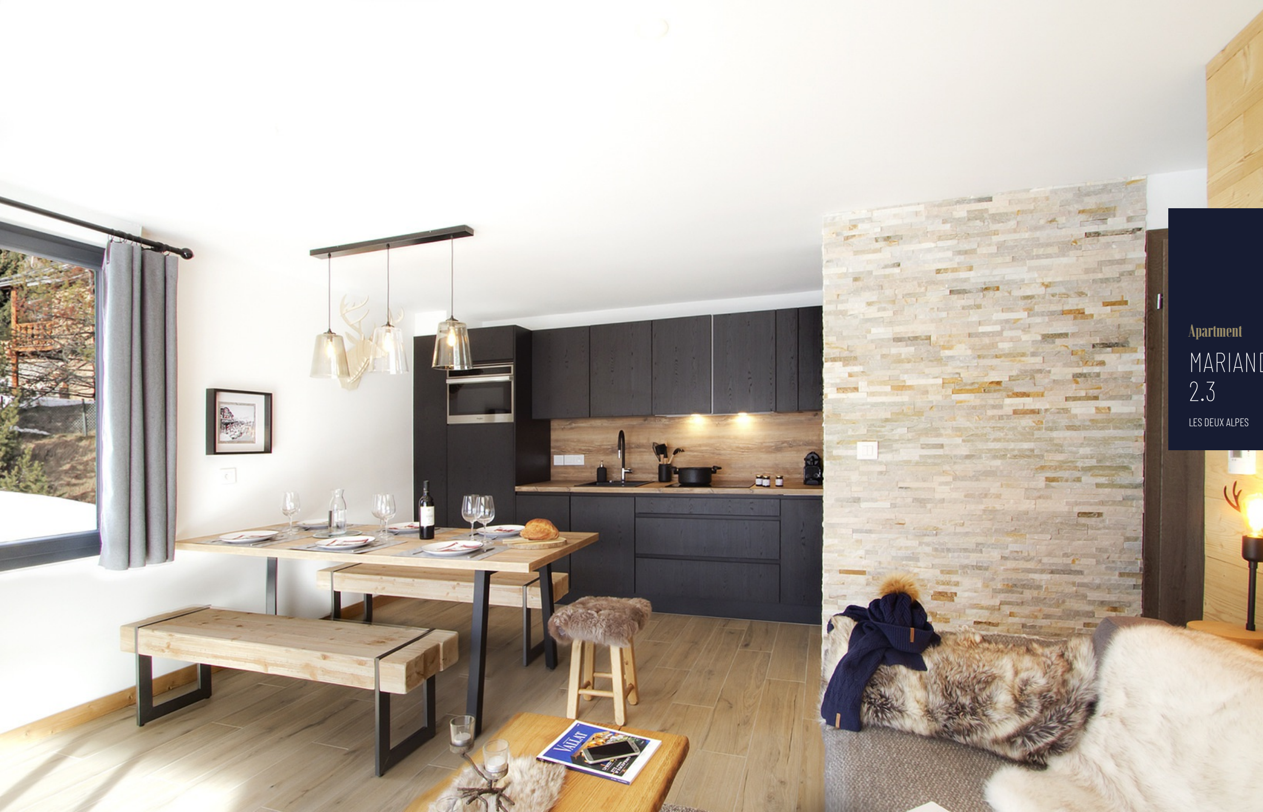
Apartment MARIANDE 2.3 LES DEUX ALPES