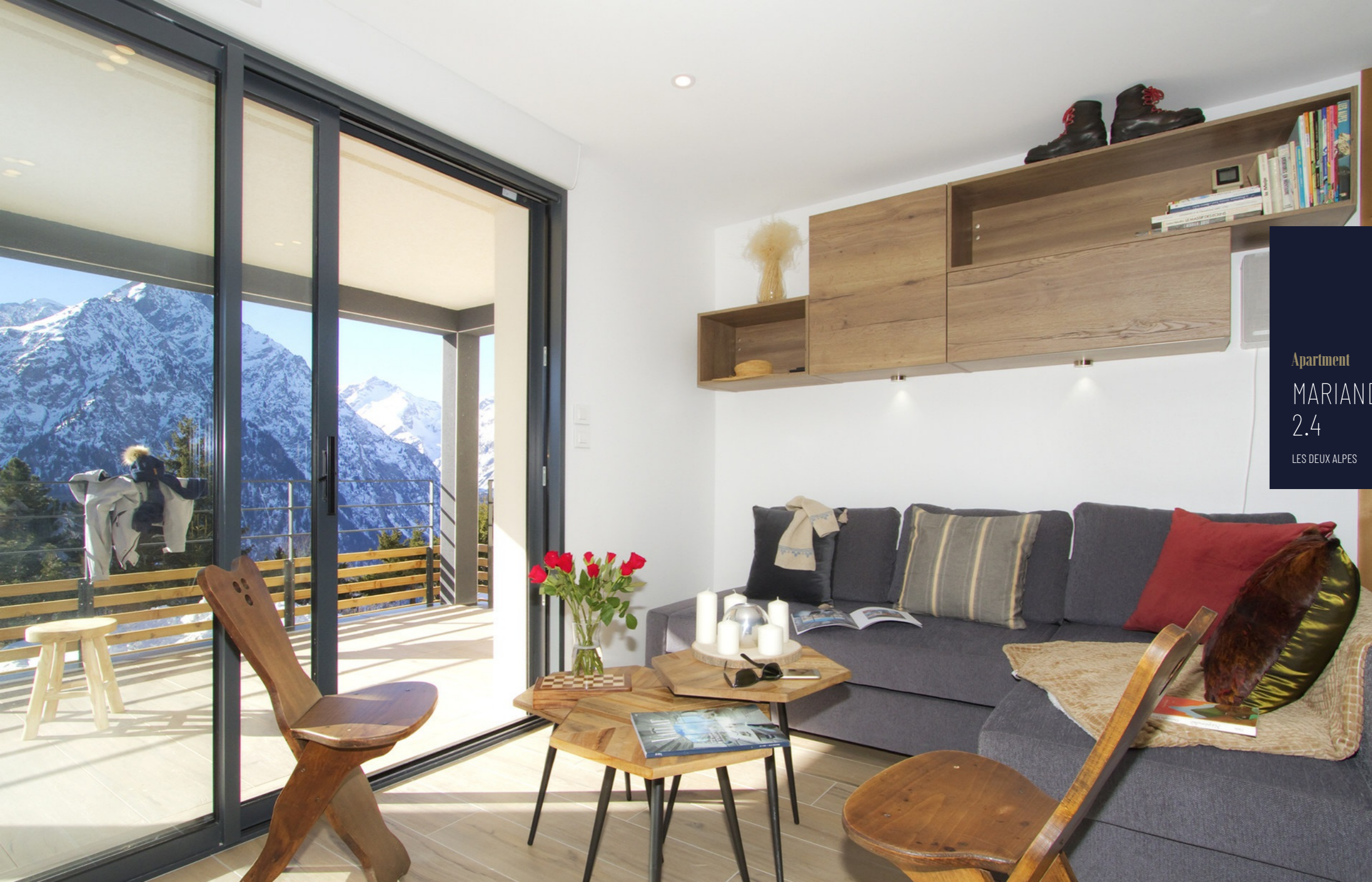
Apartment MARIANDE 2.4 LES DEUX ALPES