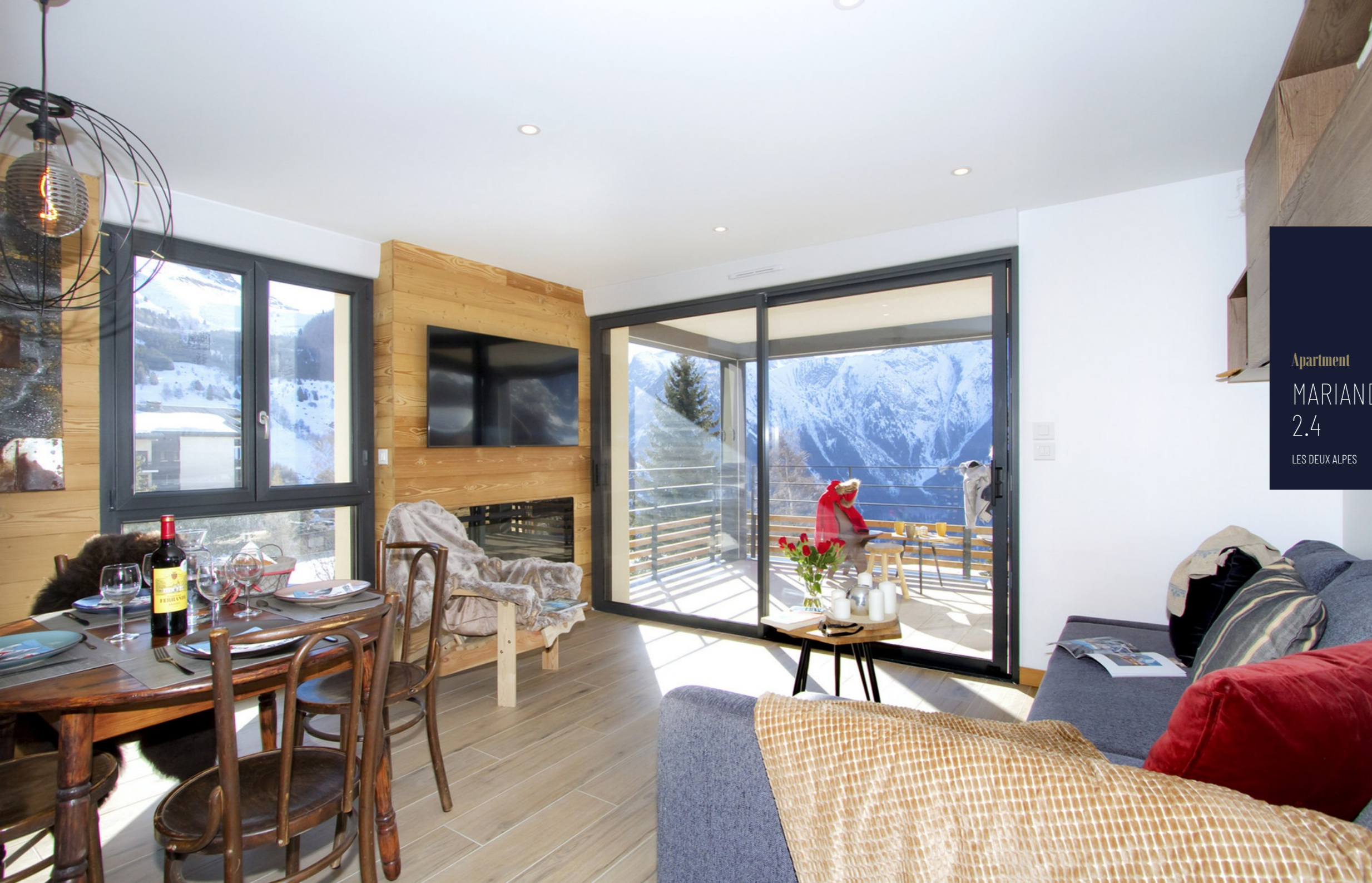
Apartment MARIANDE 2.4 LES DEUX ALPES