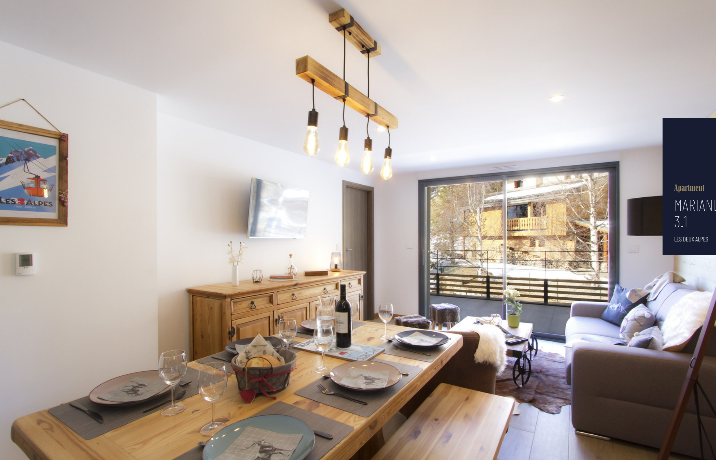
Apartment MARIANDE 3.1 LES DEUX ALPES