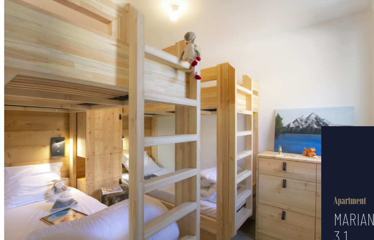
Apartment MARIANDE 3.1 LES DEUX ALPES