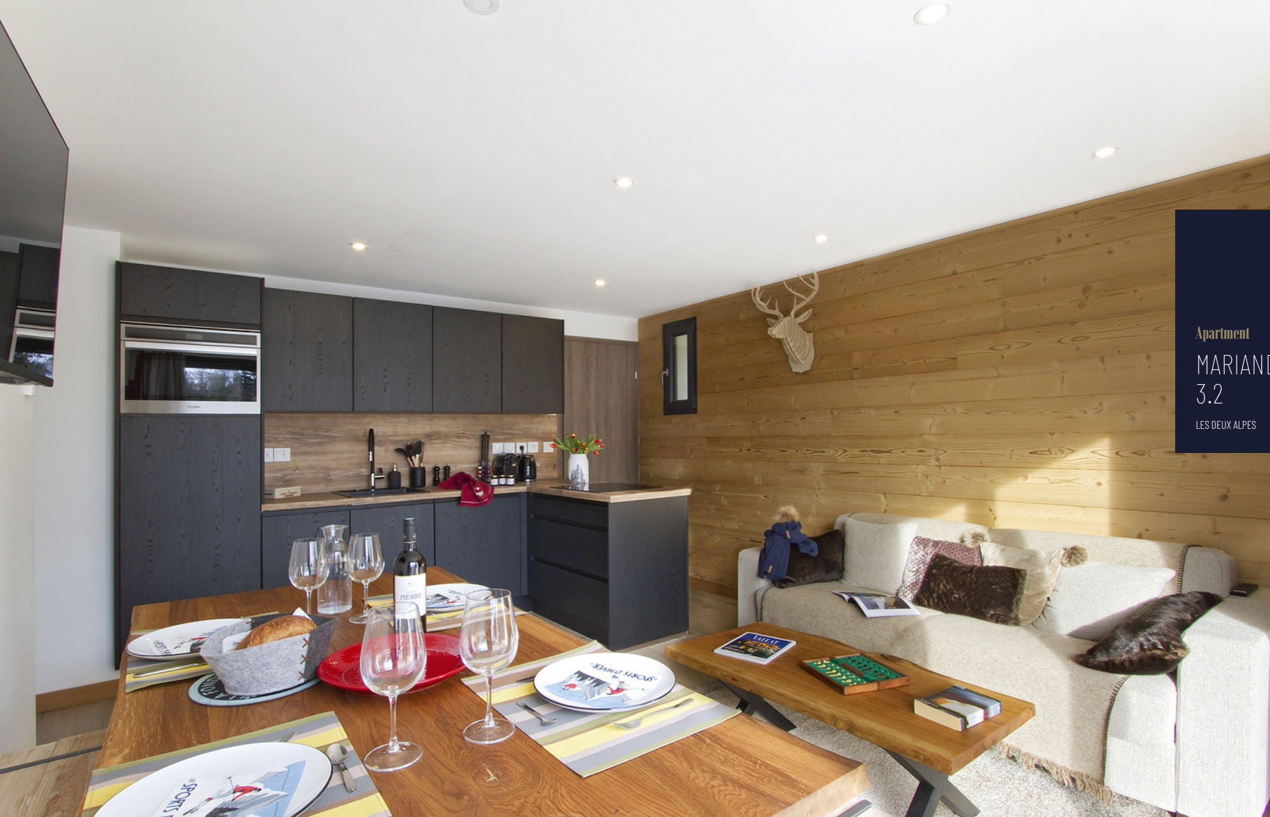
Apartment MARIANDE 3.2 LES DEUX ALPES