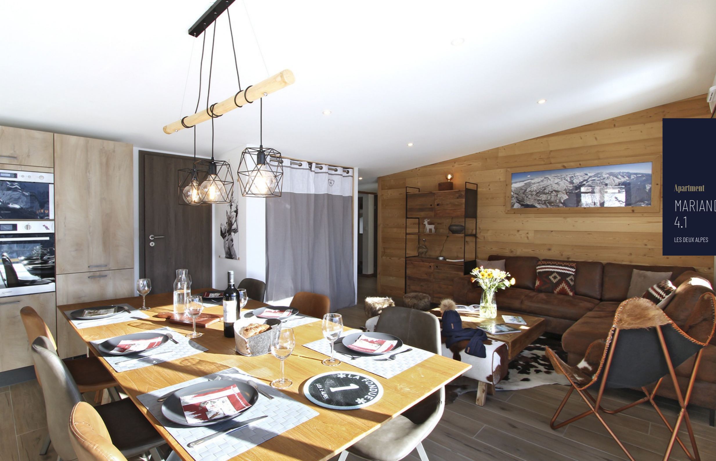
Apartment MARIANDE 4.1 LES DEUX ALPES