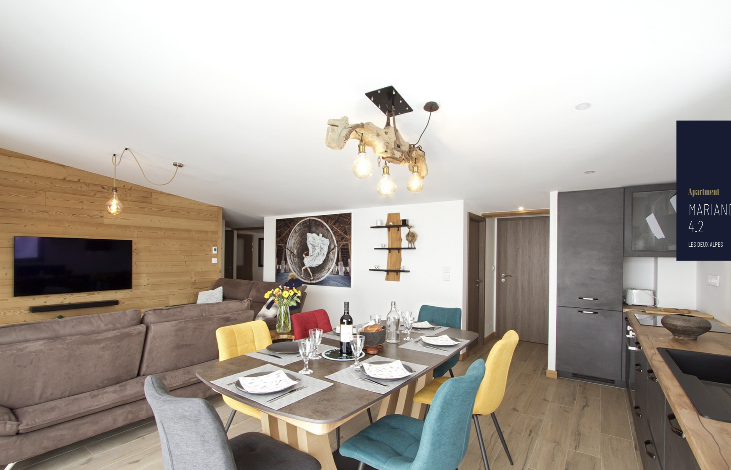
Apartment MARIANDE 4.2 LES DEUX ALPES