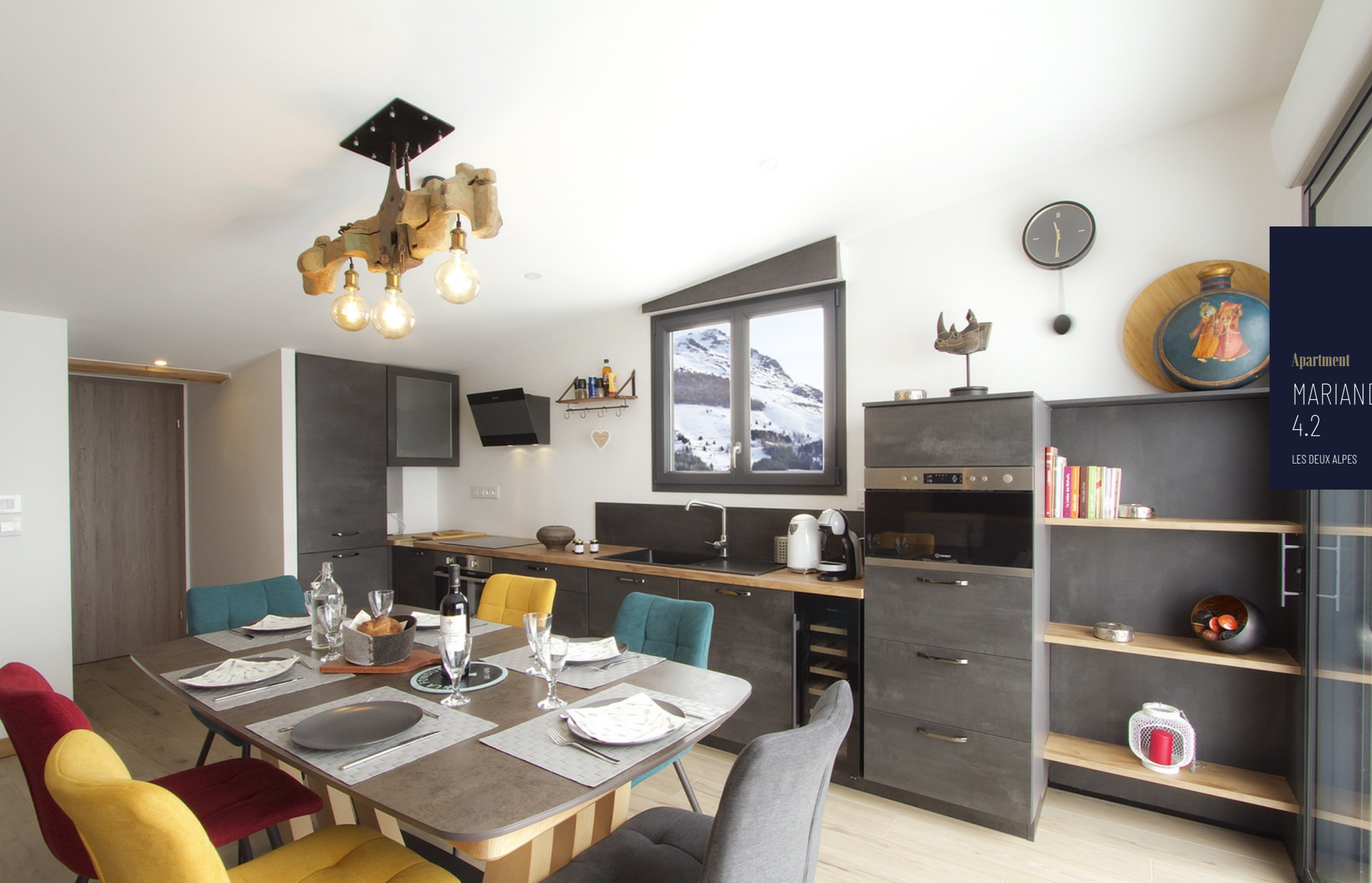
Apartment MARIANDE 4.2 LES DEUX ALPES