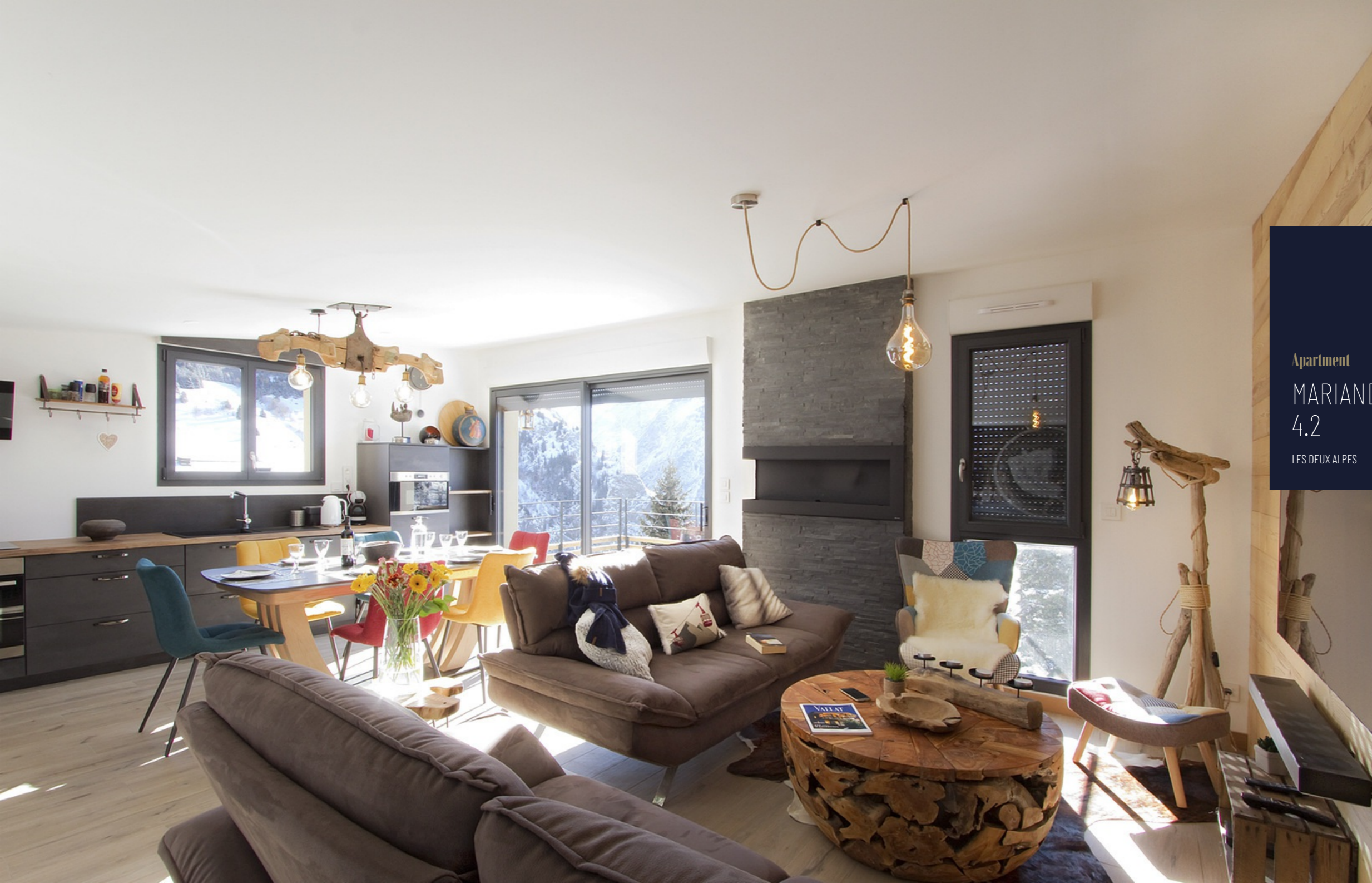
Apartment MARIANDE 4.2 LES DEUX ALPES