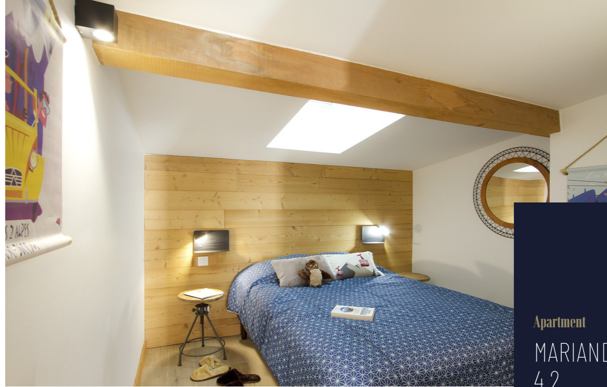
Apartment MARIANDE 4.2 LES DEUX ALPES