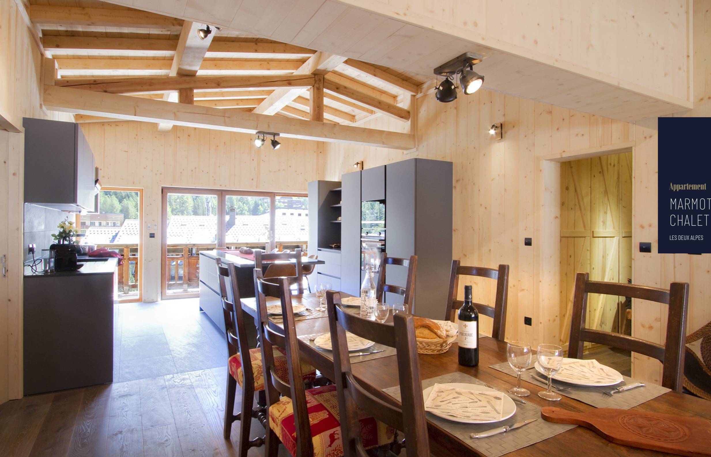
Appartement MARMOTTES PETIT CHALET LES DEUX ALPES