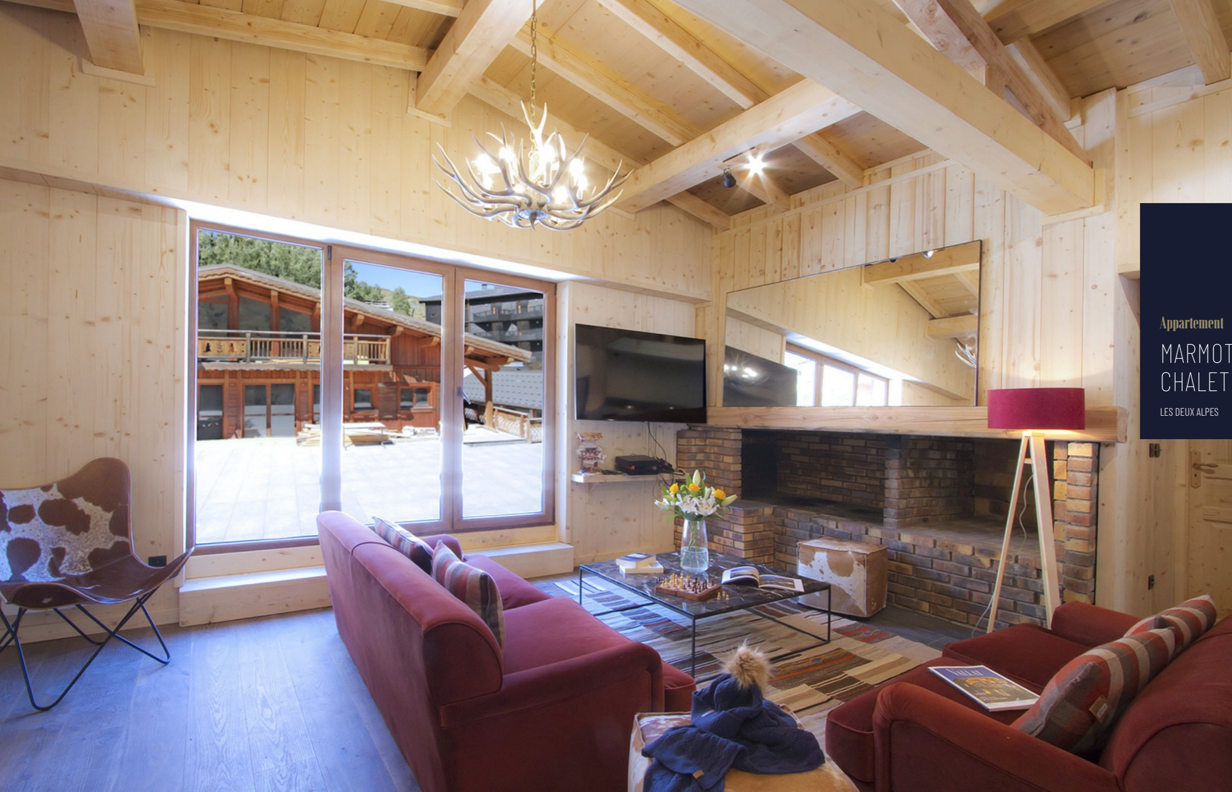
Appartement MARMOTTES PETIT CHALET LES DEUX ALPES