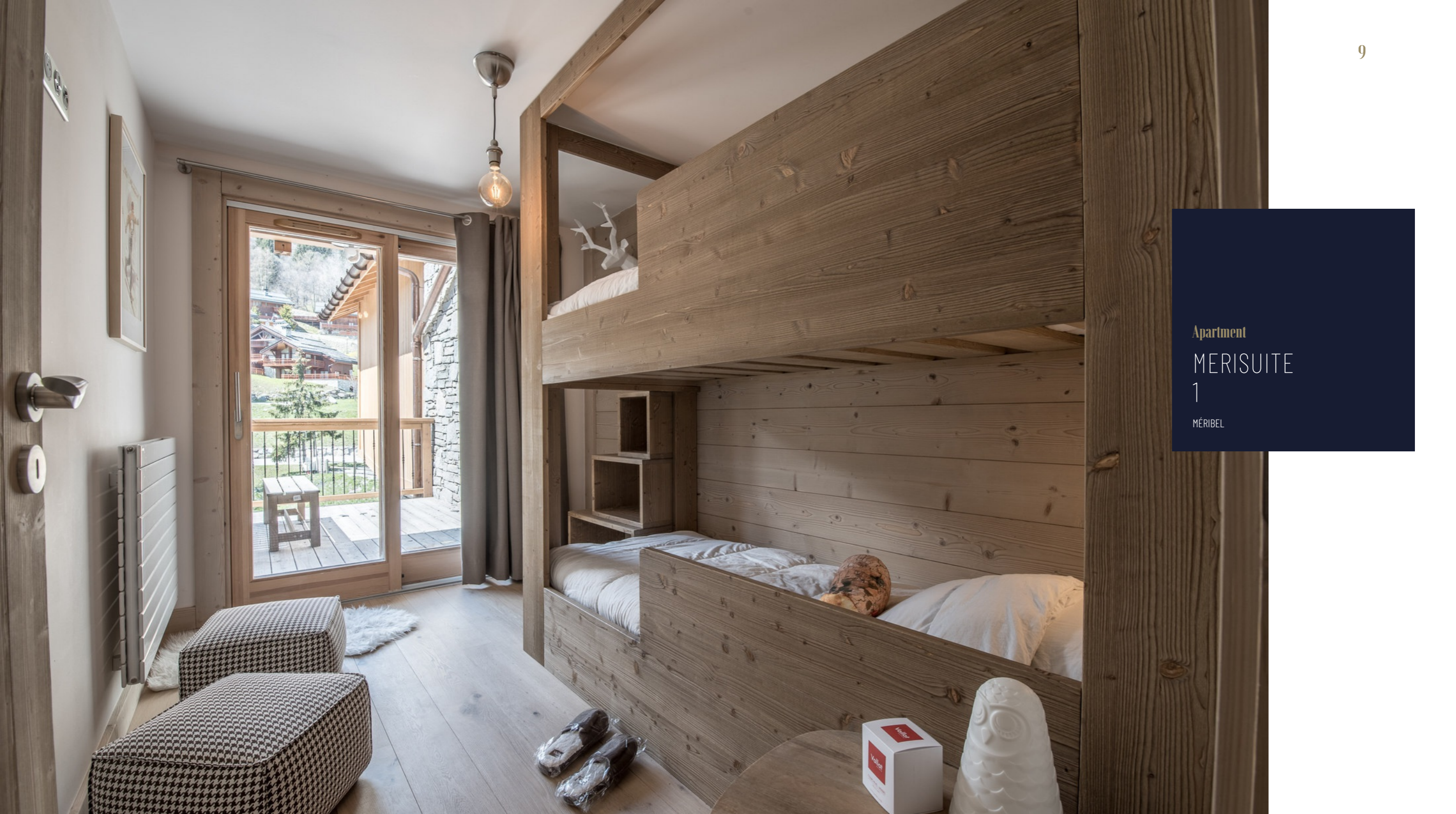
Apartment MERISUITE 1 MÉRIBEL