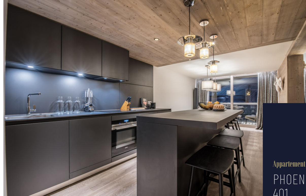
Appartement PHOENIX 401 COURCHEVEL