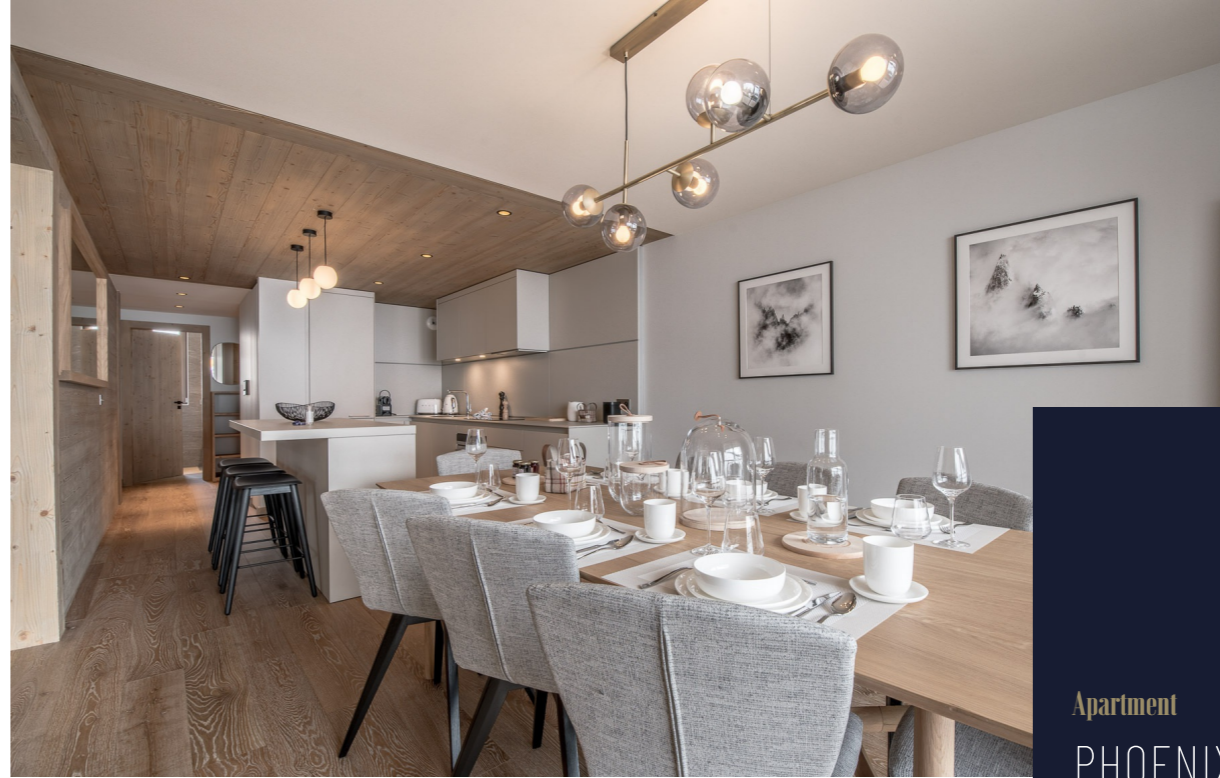
Apartment PHOENIX601 COURCHEVEL | FRENCH ALPS