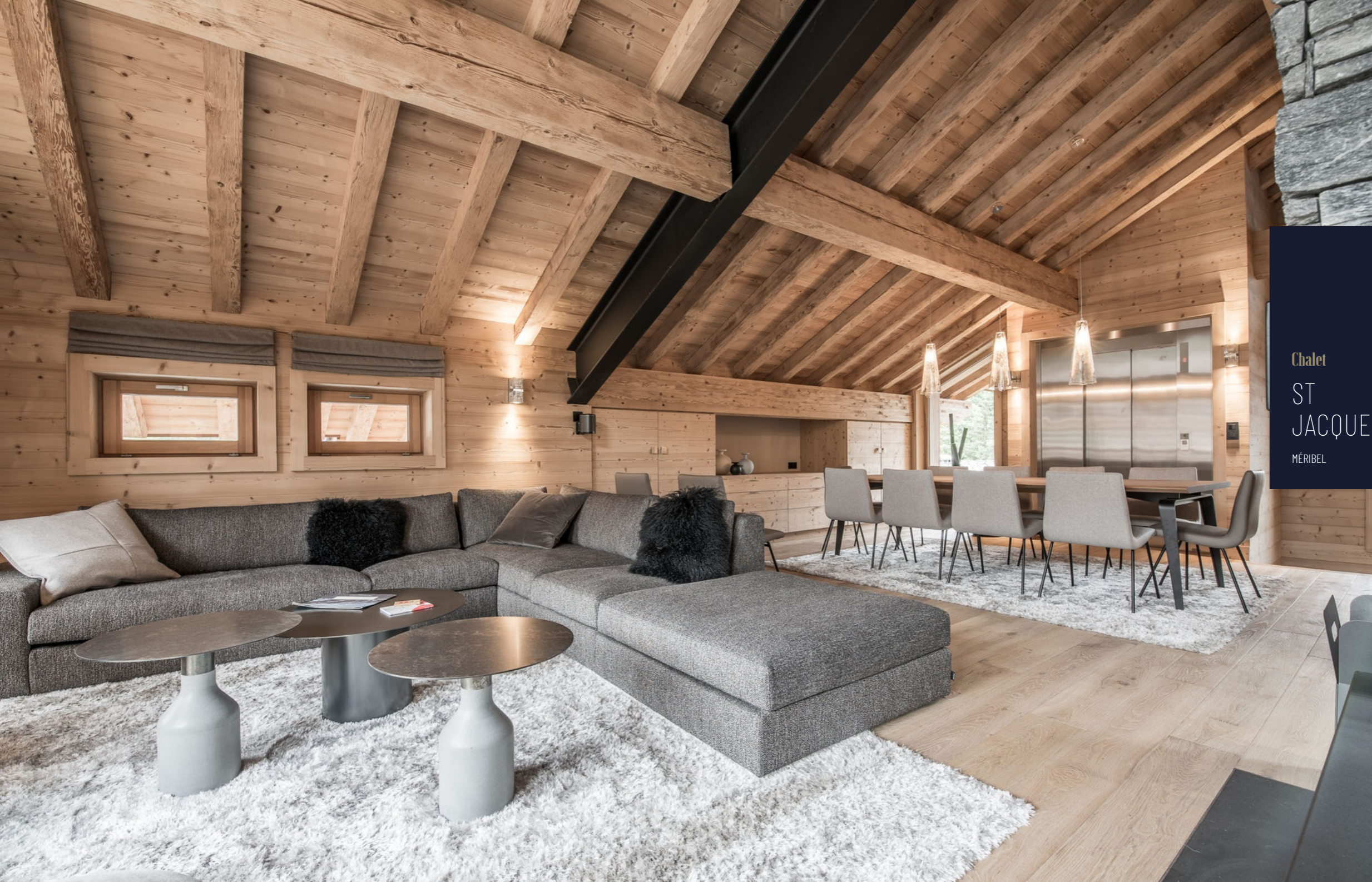
Chalet ST JACQUES MÉRIBEL