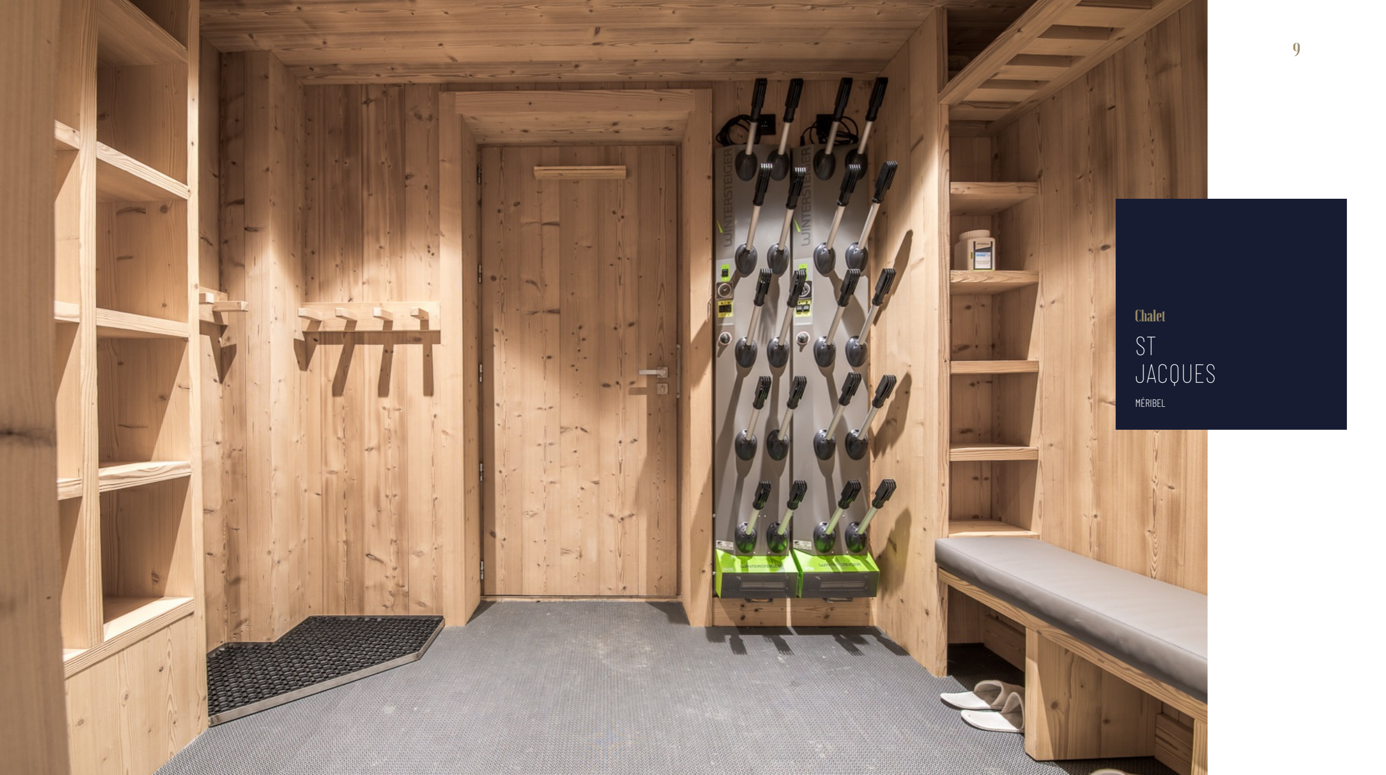
Chalet ST JACQUES MÉRIBEL