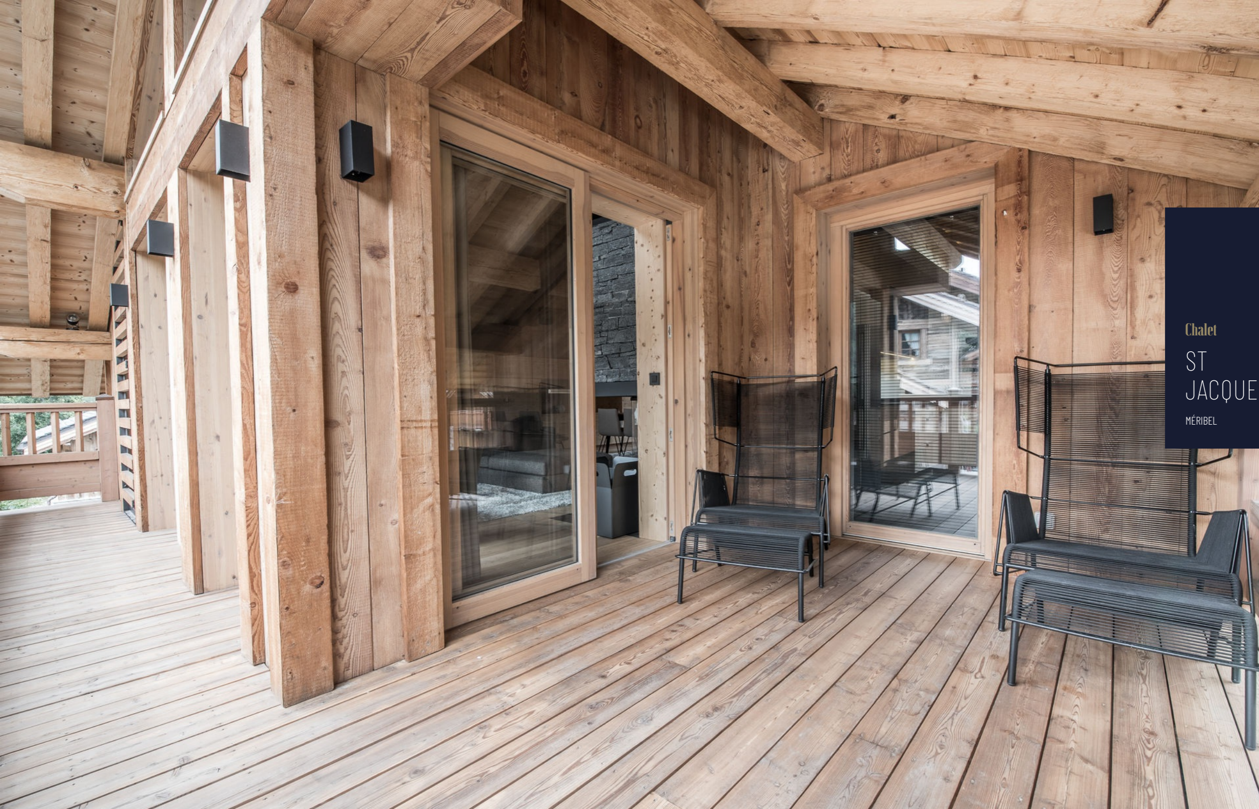
Chalet ST JACQUES MÉRIBEL