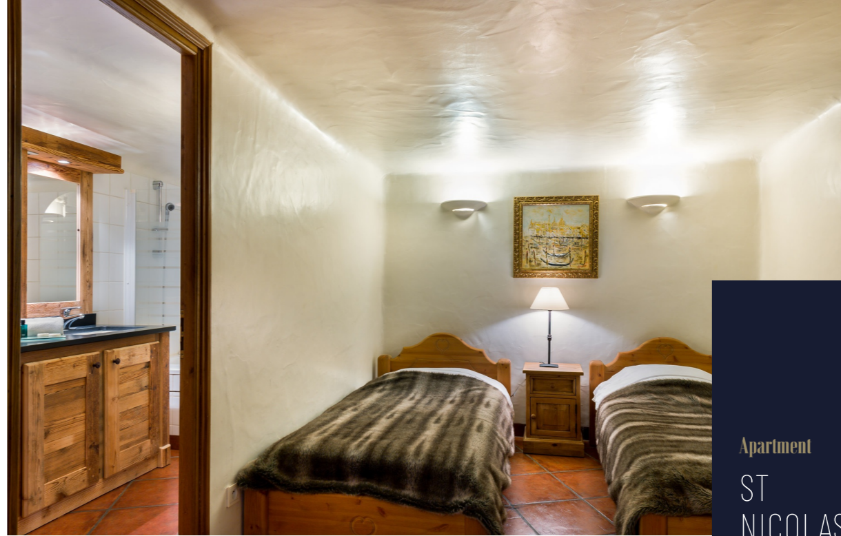
Apartment ST NICOLAS COURCHEVEL | FRENCH ALPS