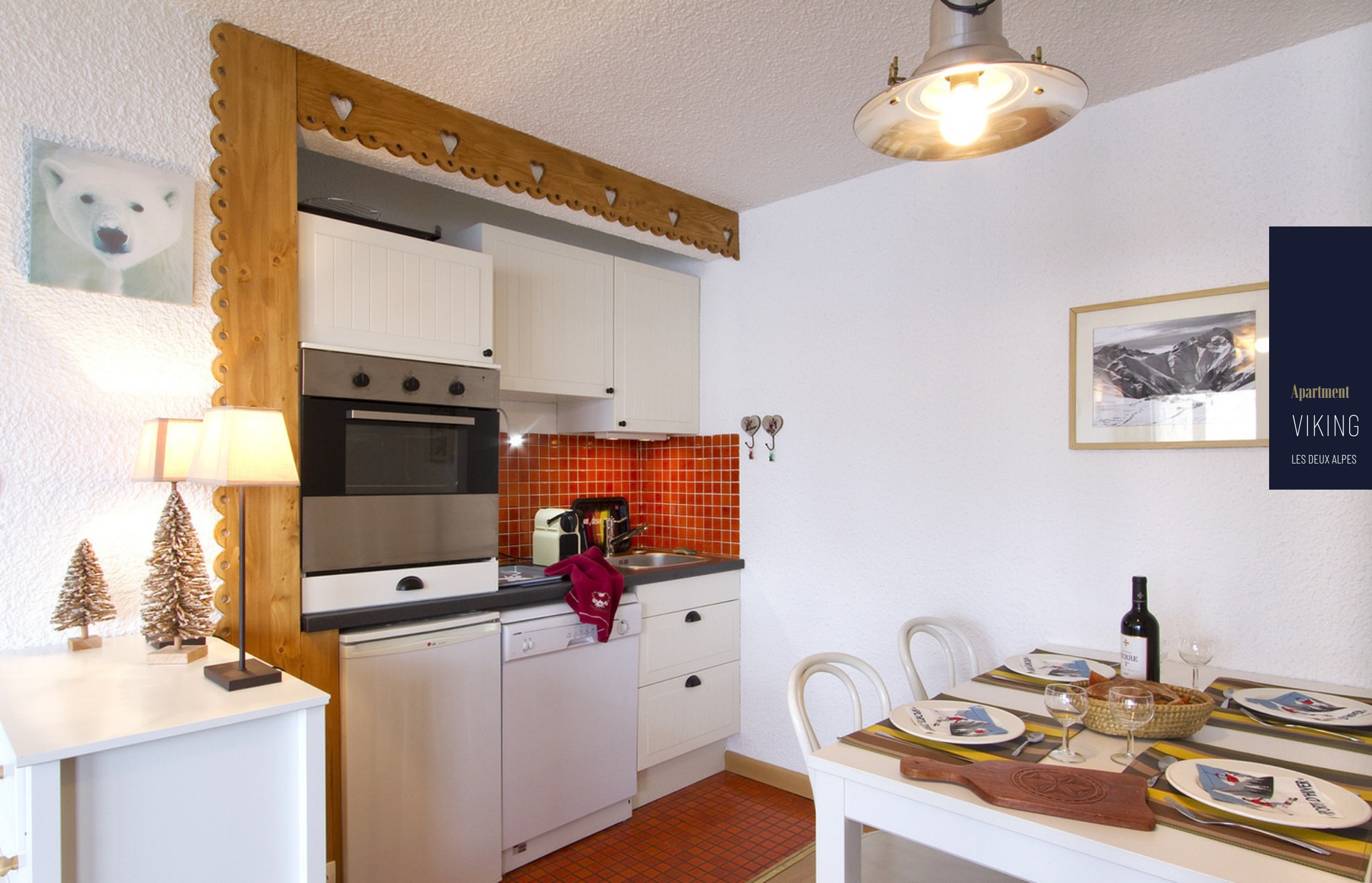
Apartment VIKING LES DEUX ALPES