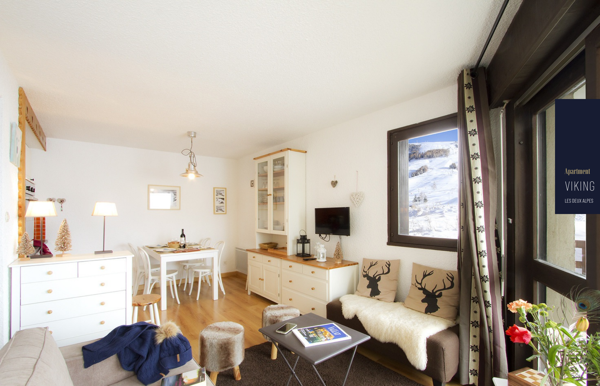
Apartment VIKING LES DEUX ALPES